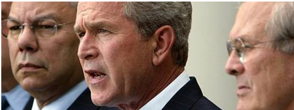
Colin Powell, George W. Bush und Donald Rumsfeld

Mit einem fiktiven Verdacht, den man jeder Person anhängen kann ohne sich rechtfertigen zu müssen, ist es nun den kriminellen Elementen des Staates möglich, jeden Bürger, der in irgendeiner Weise unangenehm auffällt – einzusperren und nach Guantanamo zu verschleppen oder sonst irgendwie mundtot zu machen.. .